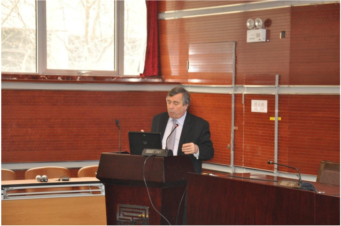
图 1：布吉尼翁教授在讲座